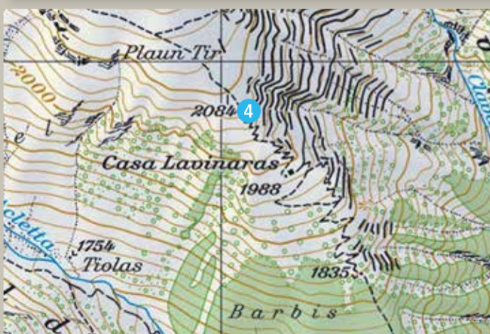
4 Plaun Tir (Sommer)

Caischedra-Plaun Tir 2 Std. S. Catrina-Plaun Tir 2½ Std.