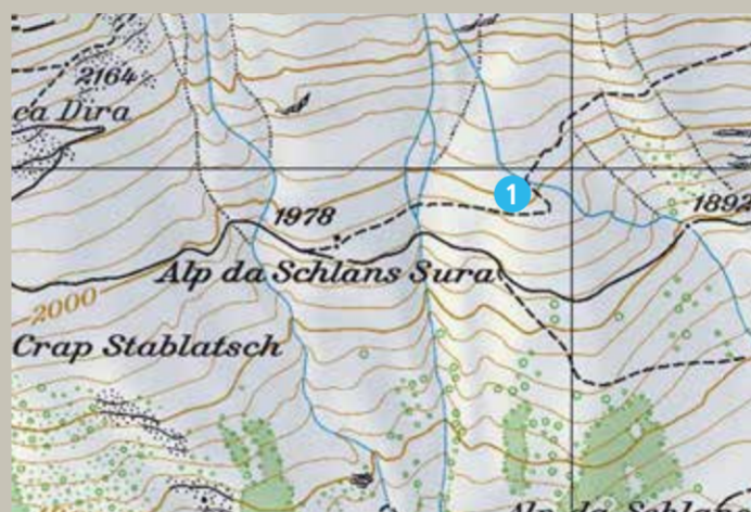
1 Alp da Schlans/Crest verd (Sommer)

Östlich vom Skilift wird auf einem flachen und dann steiler werdenden Schneefeld gestartet. Der Start erfolgt Richtung Val Gronda in der Regel links am Crap Baselgia vorbei.