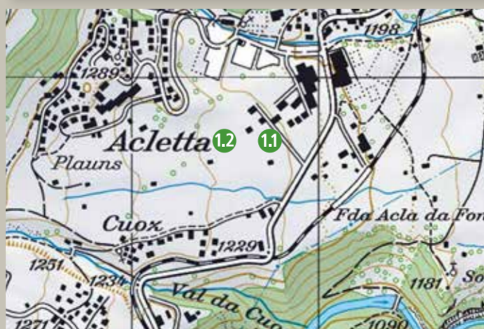
1.1 Sax Lodge (Sommer) 1.2 Wiese Sax (Winter)

Dieser Startplatz kann nur im Sommer genutzt werden, im Winter liegt er im Wildschutzgebiet.