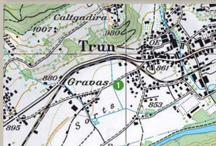
1 Trun (Winter und Sommer)

Für den Rückweg zu den Bergbahnen sind die Strassen und Wege zu benutzen. Bitte keine Wiesen queren.