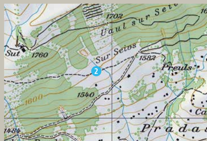
2 Pradas/Sur Seivs (Sommer)

Ab Alp Schlans geht es zu Fuss weiter entlang des Alpweges bis zum Startplatz.