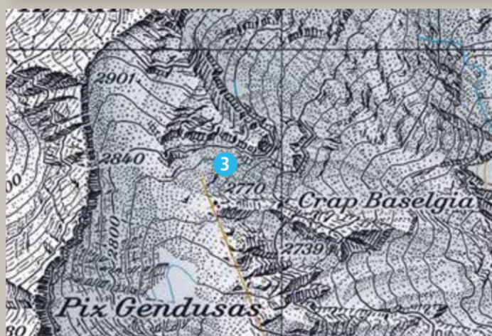
3 Péz Ault (Winter)

Der Sommerstartplatz auf Lai Alv liegt 130 m östlich vom Lift. Er ist nur zu Fuss erreichbar. Bei Rückenwind kein Start!