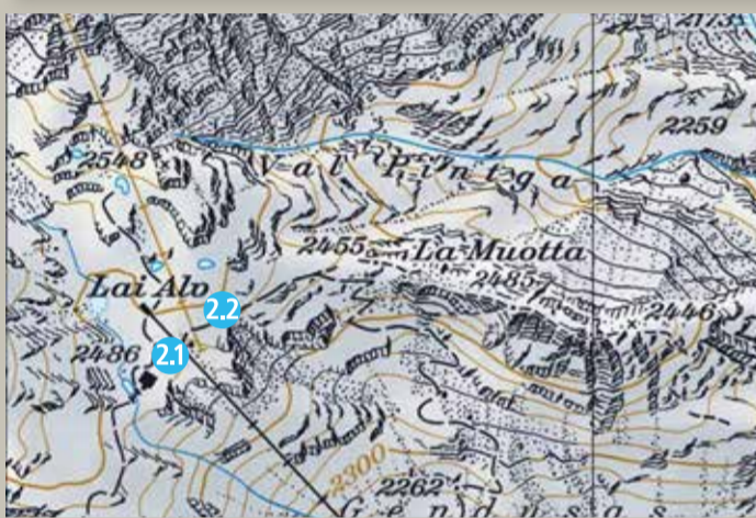
2.1 Lai Alv (Winter) 2.2 Lai Alv (Sommer)