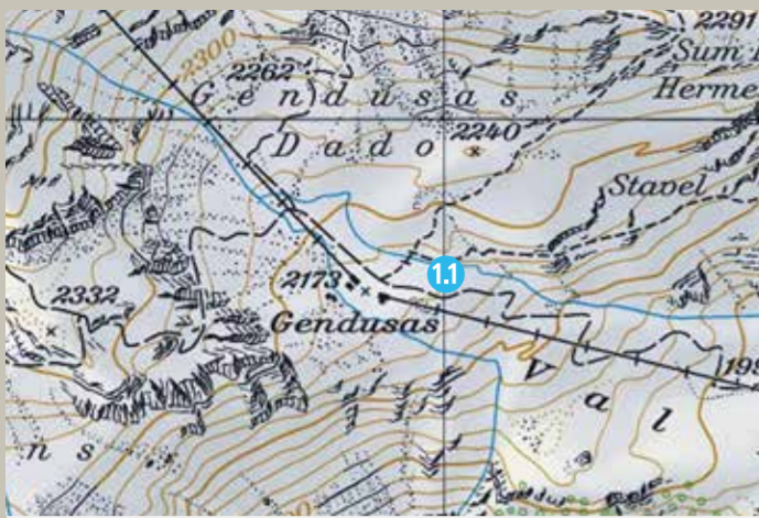
1.1 Gendusas unten (Sommer)