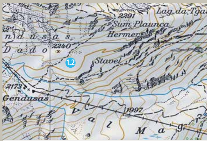
1.2 Gendusas oben (Sommer)

Im Sommer ist die Sesselbahn nur nach Rücksprache mit den Bergbahnen Disentis in Betrieb.